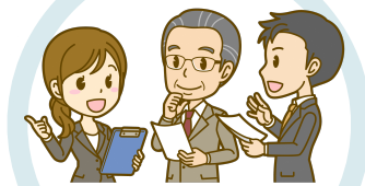
商品開発 # 技術の導入・外注 # 研究開発