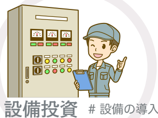
設備投資 # 設備の導入