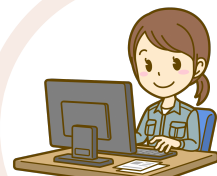
販路開拓 # 市場調査 # HP開発・改良